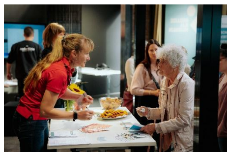
Ernährungsteam im Austausch